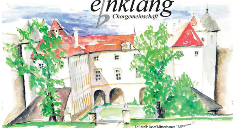
Aquarell: Josef Mitterbauer Mitterbauer 07

OPEN AIR KONZERT im Schloss Losensteinleiten